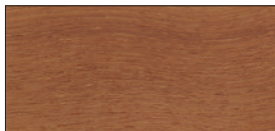
UV-Natur (auf Teakholz)